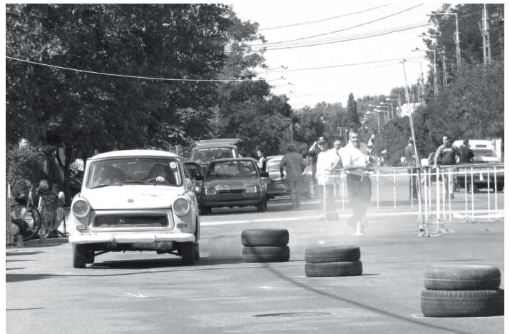
Trabantok is „ringbe” szálltak

A verseny mellett a gyerekek ugráló várban szórakozhattak, felülhettek a tűzoltó gépkocsikra, és fecskendővel célbalövést gyakorolhattak. A balesetmegelőzés jegyében