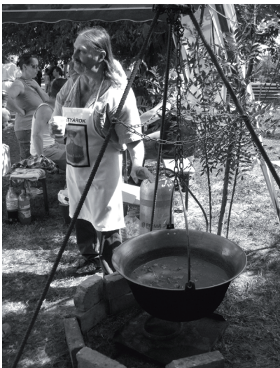
A Betyárok is fakanalat ragadtak