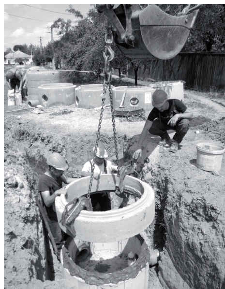
Betongyűrűket helyeznek el a Kert utca végében