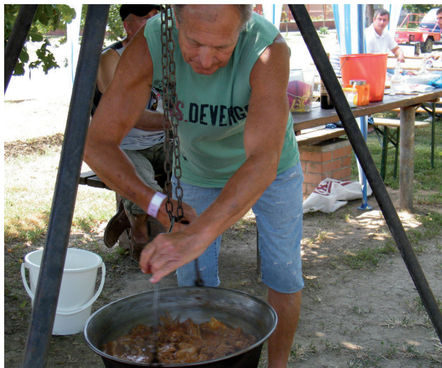
Jubileumi Kakasfőző Verseny - 7. oldal