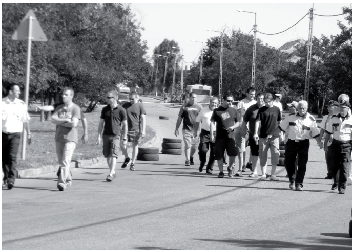
Pályabejárás a verseny előtt

A verseny 1-3. helyezettei értékes serlegekkel térhettek haza, az Abszolút 1. helyezettet és a legeredményesebb helyi versenyzőt különdíjjal jutalmazták a szervezők.