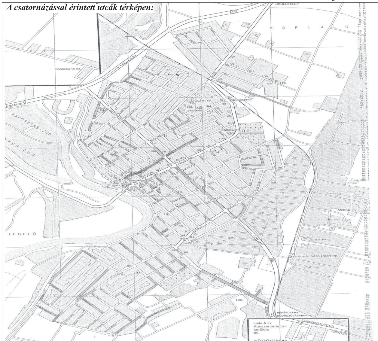
A csatornázással érintett utcák térképen: