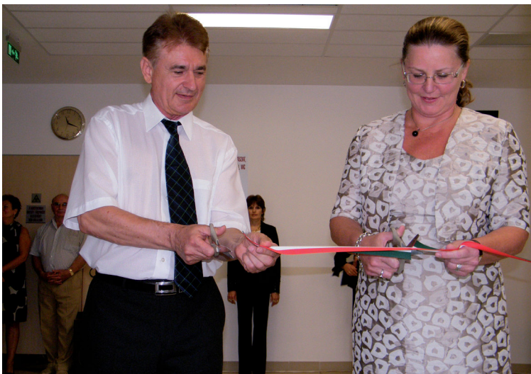
Átadták az egészségügyi központot - 3. oldal