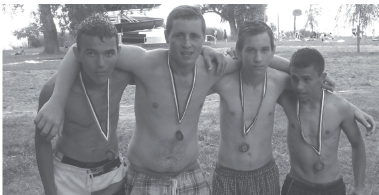
A balatonszárszói strandfoci 3. helyezett csapata