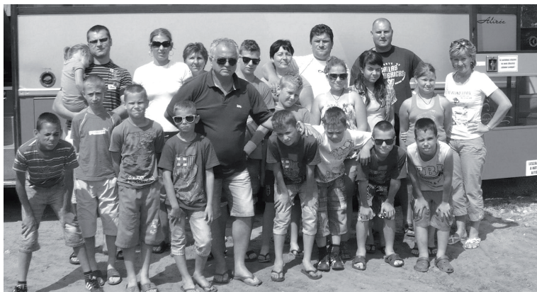
Edzőtábor a Balatonnál a szülőkkel