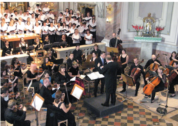
XX. Tiszazugi Zenei Fesztivál - 5. oldal