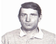
Szerető testvéreitek és családjaik (Kungyalu)

"Minden elmúlik, mint az álom, elröpül, mint a vándor madár, csak az emlék marad meg a szívben halványan, mint a holdsugár."